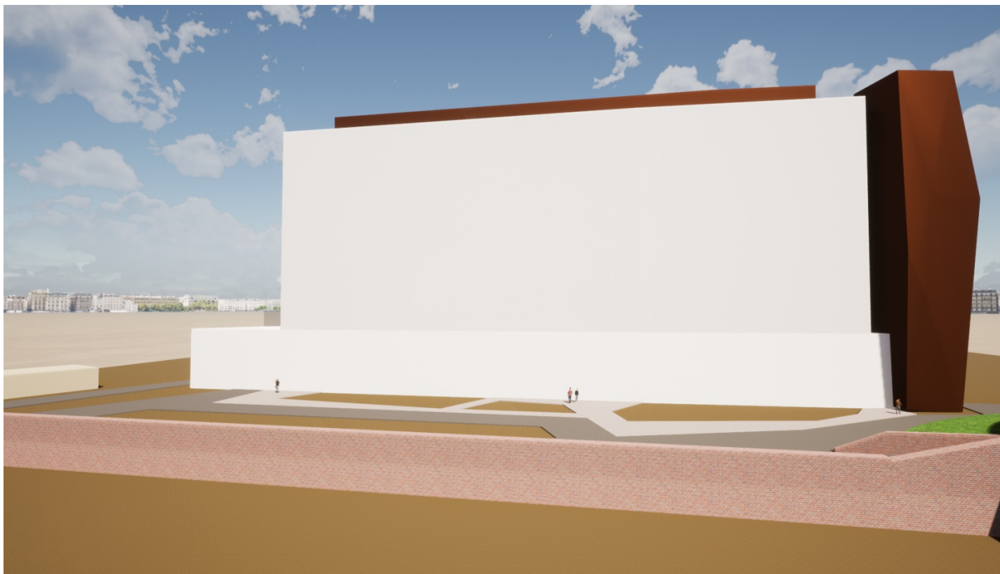
3 - Il nuovo bocco visto da fuori le mura, da Sud. (volumetrie schematiche ma con altezze e dimensioni reali, dedotte dal progetto presentato ai VV.F. nella Conferenza dei Servizi del 21 agosto 2020).